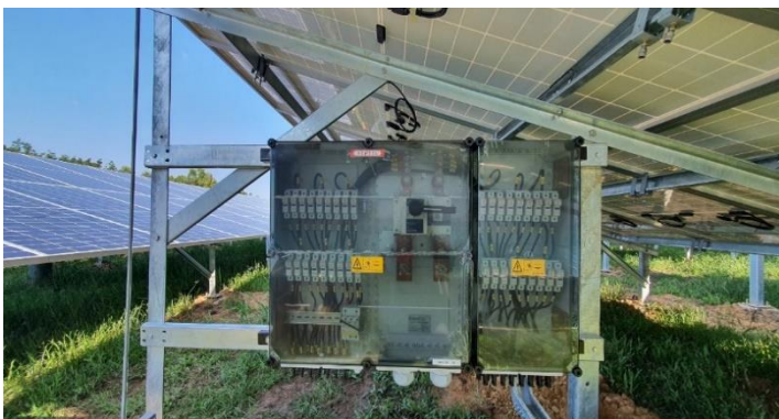
Hệ thống điện năng lượng mặt trời áp mái do Công ty CP Xây lắp – Điện thiết kế, thi công lắp đặt và vận hành.

Công ty đã nghiên cứu, thay đổi kỹ thuật lắp đặt nhằm tối ưu hóa công suất, giảm chi phí đầu tư. Giải pháp kỹ thuật của công ty là thiết kế lối đi để nhân viên kỹ thuật để vừa kiểm tra hệ thống vừa làm vệ sinh định kỳ nhằm tăng khả năng hấp thu nhiệt sinh điện.