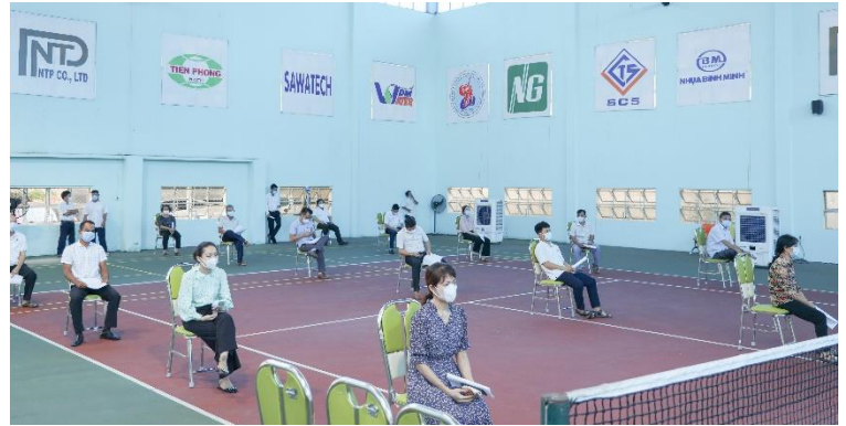
Test covid-19 cho toàn thể CBCNV hàng tuần tại công ty

• Bên cạnh các giải pháp phòng ngừa về y tế, Công ty còn thường xuyên tổ chức các giải đấu thể dục thể thao khuyến khích cán bộ công nhân viên tham gia nhằm mục tiêu rèn luyện sức khỏe, tăng sức đề kháng, thích ứng với điều kiện về phòng chống dịch Covid-19.