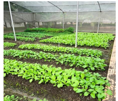
Vườn rau xanh – sạch do CBCNV Biwase tự trồng để bổ sung bữa ăn khi giãn cách do dịch bệnh

Phát huy thành quả này, các chi nhánh thuộc Biwase đã duy trì mô hình vườn rau sạch tại chỗ góp phần làm phong phú nguồn cung cấp thực phẩm và bảo đảm sức khỏe cho CBCNV công ty.