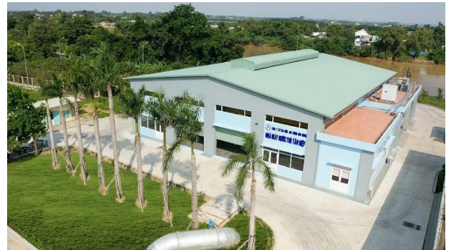
Trạm bơm nước thô Chi nhánh cấp nước Khu Liên Hợp công suất 600.000m 3 /ngày đêm

Giám đốc Chi nhánh cấp nước Khu Liên Hợp cho biết: trong hai tháng 10 và 11 năm 2021 công suất cấp nước của chi nhánh tăng mạnh do Bình Dương trở lại trạng thái bình thường mới, người dân và doanh nghiệp nghiệp trở lại hoạt động bình thường. Dự kiến tháng 12, tháng cuối của năm 2021 công suất tiêu thụ nước sạch tiếp tục tăng mạnh, đưa doanh thu cả năm của chi nhánh ước đạt như kế hoạch đề ra.