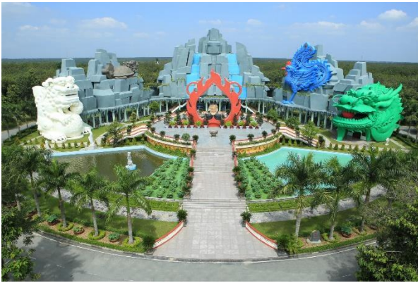
Đài Hóa Thân Hoàn vũ – Hoa viên nghĩa trang Bình Dương